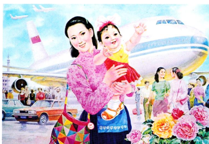
我和妈妈去旅游（宣传画，1985年）

提取材料中的信息并结合所学知识，写一篇历史短文。（要求：主题明确，史论结合，逻辑严谨，表述成文）