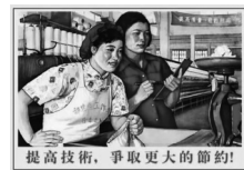
D. 揭示了科教兴国战略的意义