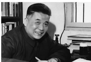
1986 年全国劳动模范邓稼先