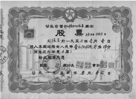
图二 1956 年的公私合营股票凭证

(1)据材料一并结合所学知识,指出“革命新道路”和“新社会制度”各是什么。(6 分)