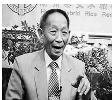
1979 年全国劳动模范袁隆平