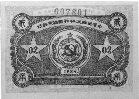
图一 1934 年中华苏维埃共和国国家银行发行的货币

材料一 下面两幅图片所示的文物分别是中国共产党开辟革命新道路和建立新社会制度两大成就的见证。