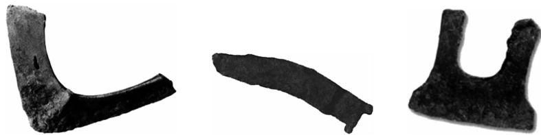
河南辉县出土的铁犁头 河北易县出土的铁镰刀 河南辉县出土的铁锄口

2. [2024 河南中考]战国时期的这些农具(见下图)虽貌不惊人,但其锋利已经悄无声息地划开了一个崭新的时代。这里的“锋利”可以理解为( )