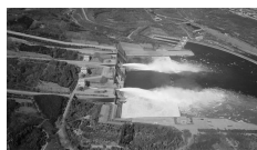
黄河小浪底水利枢纽工程

材料二 春秋时期,黄河下游两岸的诸侯国开始修筑堤防。北宋时期治河仍以筑堤、堵口和开引河等